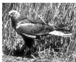
falco di palude